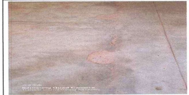
Foto 6: El piso se encuentra en las malas condiciones, se sustituirá por pisos cerámico.

Observación: Si es necesario se pueden agregar hojas adicionales y actualizar el número de hojas.