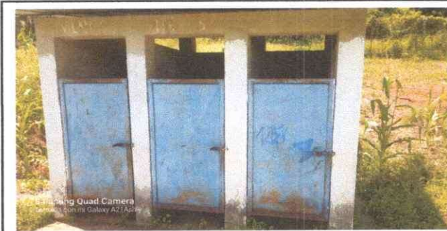
Foto 5: El servicio sanitario se encuentra en mal estado, se necesita mejorar las puertas y repintarla..