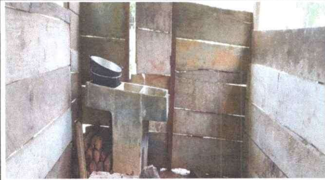
Foto 1: El depósito de agua hace falta, ya que lo que cuenta la escuela esta muy deteriorada.