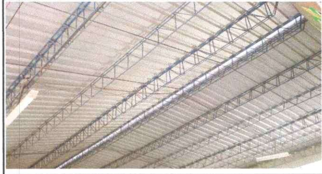
Foto 2: La escuela se necesita un buen ambiente, durante el verano es insoportable el calor por eso es necesario instalación de cielo falso.