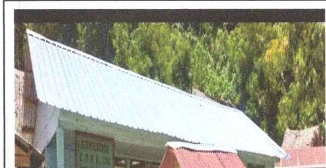
Foto 4: Se necesita las instalaciones de los canales en el techado, ya que cuando llueve gotea el agua en el salón de clase.